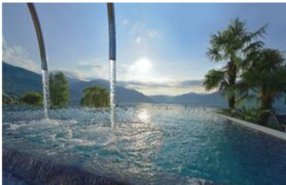
Foto (download): Abkühlung an heißen Tagen gibt's im Splash Pool auf der Dachterrasse des Hotel Cort, Palma/Mallorca.

außerdem einen eigenen Whirlpool auf der privaten Terrasse. Das DZ/F kostet ab 165 €. www.hotelcort.com