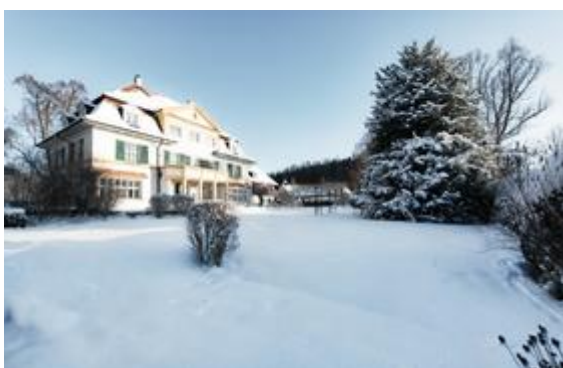
Foto (download): Die meisten Hotels und Restaurants in Schenna halten attraktive Silvester-Packages bereit. Bildnachweis: Tourismusverein Schenna/Frieder Blickle

Highlight: Wenn um Mitternacht das neue Jahr begrüßt wird, genießen sie auf Schennas Panoramaterrassen exklusive Ausblicke auf das Spektakel im Tal. www.schenna.com