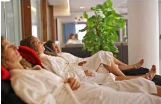
Foto (download): Im Schlossgut Oberambach feiern Gäste das Silvesterfest in entspannter Atmosphäre.

Zwölf Schläge, zwölf Trauben. Wer es vorzieht, Silvester entspannt auf der Son Manera Retreat Finca von Indigourlaub und somit auf den Balearen zu verbringen, begrüßt das neue Jahr neben dem normalen Yogaprogramm mit einem festlichen Silvestermenü aus köstlichen Tapas. Damit der Tradition nach im neuen Jahr auch die innigsten Wünsche in Erfüllung gehen, sind auf der Finca Weintrauben unerlässlich. Bei jedem Glockenschlag um Mitternacht wird eine Traube