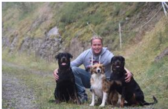
Foto (download): In Schenna/Südtirol reicht die Auswahl an hundefreundlichen Unterkünften von der gemütlichen Pension bis zum schicken Vier-Sterne-Superior-Hotel.

Spiel und Spaß beim Hundeflüsterer. Besondere Services für Vierbeiner bietet der Südtiroler Hannes Conci an. So unternimmt der zertifizierte Hundetrainer beispielsweise jeden Samstag von Ostern bis Allerheiligen eine spezielle Wanderung rund um Schenna bei Meran. Auf Wunsch unterstützt er auch dabei, das harmonische Zusammenleben zwischen Mensch und Tier zu verbessern: Mithilfe von speziellen Techniken lernen Hundehalter, ihrem Liebling verständlich zu machen, was