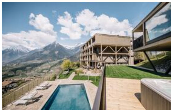
Foto (download): Von der Dachterrasse des Apartment 7 in Schenna schauen Gäste auf die Gipfel der Südtiroler Bergwelt, während sie im Infinity Pool planschen.