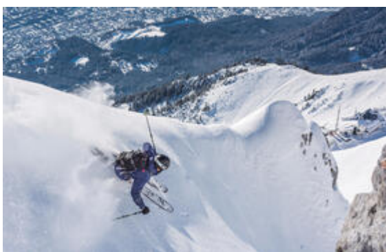
Foto (download): Vom aDLERS Lifestyle-Hotel Innsbruck gelangen Wintersportler in Kürze in die umliegenden Tiroler Skigebiete.

Von der „Gruabn“ bis zum „weißen Dachl“. Ganze 13 Skigebiete rund um Innsbruck lassen Skifahrer-Hezen höher schlagen. Die Vielseitigkeit ist groß, denn die meisten zeichnen sich durch ihren ganz eigenen Charakter aus. Für alle City-Berg-Kombinierer etwa lohnt sich das „Haus-Skigebiet“ der Innsbrucker, die Seegrube (1.905 Meter) auf der Nordkette. In nur 20 Minuten geht's vom Zentrum per Bergbahn hoch auf die „Gruabn“, wie die Einheimischen ihre Wintersportheimat liebevoll