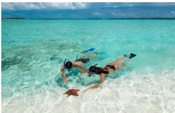
Foto (download): Romantisch wohnen Paare in den herzförmig angelegten „Over-the-Water“-Bungalows des Sandals Royal Caribbean/Jamaika.

Verlobung. Ein Heiratsantrag am Korallenriff unter Wasser, beim Candle-Light-Dinner im weißen Karibiksand oder während eines privaten Segelausflugs in den Sonnenuntergang? Die Fantasie der Verlobungs-Conciergen in den Sandals Resorts kennt kaum Grenzen. Die Kreativexperten beraten nach den Wünschen ihrer Gäste und planen jedes Detail.