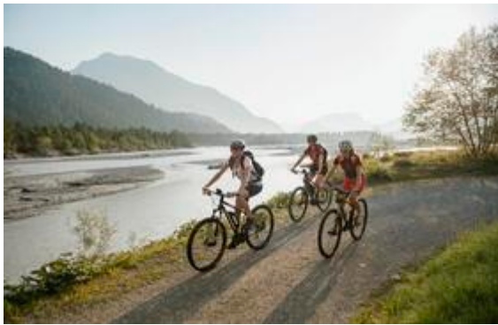
Foto (download): Auf der Kneipp-Radrunde bei Füssen, Teil des gesundheitstouristischen Erlebnisraums „Lebensspur Lech“, liegen für jede der fünf Kneipp’schen Säulen entsprechende Stationen am Wegesrand.