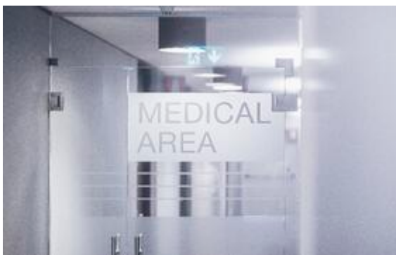
Foto (download): Thermalwasser-Inhalationen wirken sich positiv auf Atemwegserkrankungen aus - das beweisen die medizinischen Forschungen der Therme Meran.

Die Therme Meran ist nicht nur ein Ort der Entspannung und des Wohlfühlens. Auch die Wissenschaft hat ihren Platz im Südtiroler Signature Spa gefunden. Beim Ärztekongress „Die Thermal Therapie: Mythos oder Wahrheit“ am 10. September 2022 treffen sich die Fachleute im Hotel Therme Meran und erfahren mehr darüber, wie sich das medizinische Verfahren auf verschiedene Krankheitsbilder auswirkt. „Wir haben gerade eine neue Entdeckung gemacht, die revolutionäre Effekte auf die Behandlung von Atemwegserkrankungen haben könnte: nämlich die wirksame Bekämpfung von Antibiotika-Resistenzen durch den Kontakt mit Thermalwasser“, erklärt Dr. Salvatore Lo Cunsolo, ärztlicher Leiter der Medical Area in der Therme Meran. Im Rahmen weiterer Studien hofft der Experte zu beweisen, dass Thermalwasser bei der Heilung chronischer Krankheiten und der Minimierung des Antibiotikaverbrauchs helfen kann. Mit acht CME-Punkten ist der Kongress unter Schirmherrschaft der Fakultät für Biomedizin, Chirurgie und Zahnmedizin an der Universität Mailand eine wichtige Fortbildungsveranstaltung für Mediziner, Anmeldung mittels QR-Code noch bis 8. September 2022, weitere Infos unter Tel. +39 0473 252007 oder unter locunsolo@thermemeran.it . www.termemerano.it/medical