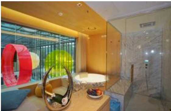
Foto (download): Was für ein Blick! Diesen genießen Therme-Meran-Gäste, die sich eine Relax Lounge am Seerosenteich in Südtirols Signature Spa mieten.

Nur Du und ich. Lässt sich die Südtiroler Sonne mal nicht blicken, mieten sich Pärchen eine der exklusiven Pool Suites, die uneinsehbar über der Badehalle der Therme Meran schweben. Dort erleben sie Deluxe-Wellness ohne Publikum und genießen die Zeit im privaten Whirlpool, Dampfbad oder auf dem Wasserbett. Wer mag, bucht ein Paar-Treatment, bei dem die hauseigene Naturkosmetik-Linie des MySpa zum Einsatz kommt. Sie wird zu 100 Prozent aus regionalen